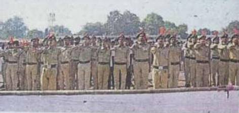
शपथ में शामिल एनसीसी कैडेट ।