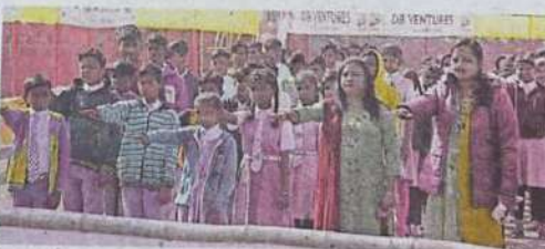
शपथ में शामिल जिलासा, डीपी के शरवानी व शाउमापि जाजगीर के विद्यार्थी व व्याख्याता • नईदुनिया