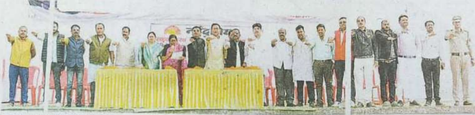
शपथ लेते नगर के जनप्रतिनिधि • नईदुनिया

इम दौड़ती भागती सड़कों पर... जिज्ञासा, रुचि और सुरक्षा की राशीका