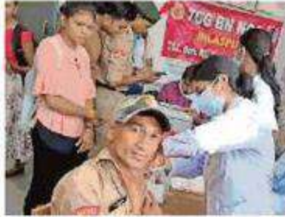
टीका लगाती स्वास्थ्यकर्मी