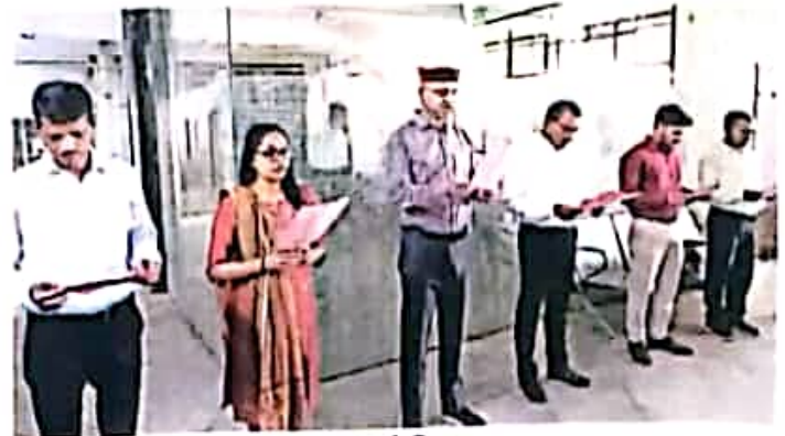
उपस्थित कलेक्टर व अन्य अधिकारी •