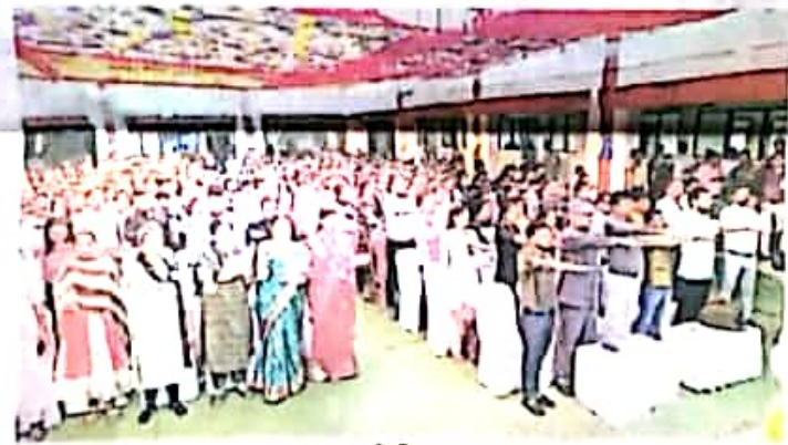
जेपीजी - शपथ लेते उपस्थित लोग • नईदुनिया

कलेक्टर एवं जिला निर्वाचन अधिकारी ने अभ्युत्थान करने हुए लोकतंत्र में अपनी पूर्ण आस्था रखने तथा देश के लोकतांत्रिक परम्पराओं को मर्यादा बनाए रखने एवं स्वतंत्र, निष्पक्ष एवं शांतिपूर्ण निर्वाचन की गरिमा को अक्षुण्ण रखते हुए, निर्भिक होकर, धर्म, वर्ग, जाति, समुदाय, भाषा अथवा अन्य किसी भी प्रलोभन से प्रभावित हुए बिना सभी निर्वाचनों में अपने मताधिकार का प्रयोग करने की शपथ दिलाई। भारत निर्वाचन आयोग द्वारा जारी गीत - मैं भारत हूँ का श्रवण किया गया।