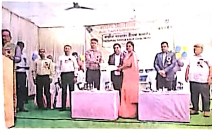
सहायक प्राध्यापक को सम्मानित करते अतिथि • नईदुनिया

जांजगीर-चांपा (नईदुनिया न्यूज)। हरद्वे राष्ट्रीय मतदाता दिवस के अवसर पर बुधवार को शासकीय जाज्वल्यदेव नवीन कन्या महाविद्यालय जांजगीर में राष्ट्रीय मतदाता दिवस समारोह का आयोजन किया गया। "मधिम लाइक कोटिंग, आई वोट फार श्योर मैकिंग थीम पर आयोजित कार्यक्रम में उत्कृष्ट सेवा देने वाले प्रोफेसर, नोडल अधिकारी और वीएलओ को सम्मानित किया गया। अतिथियों द्वारा समारोह का शुभारंभ छत्तीसगढ़ महतारी के चित्र पर दीप प्रालित कर किया गया। कार्यक्रम में मतदाताओं को जागरूक करने रंगोली भी बनाई गई थी। अतिथियों द्वारा युवाओं को मतदान के लिए प्रेरित करने के साथ रंगोली का अवलोकन भी किया गया।